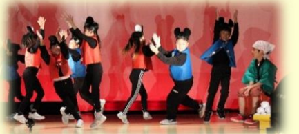
1年 おむすびころりん

これらの経験は必ずや次に生かされることでしょう。学芸会のビフォー・アフターでは、大きな違いがあると信じています。成長し続ける子ども達を支えてくださいますようお願いいたします。