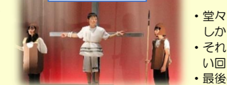
5年 走れ メロス