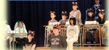
6年 カチカチ山裁判