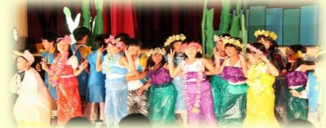
2年 リトル マーメイド